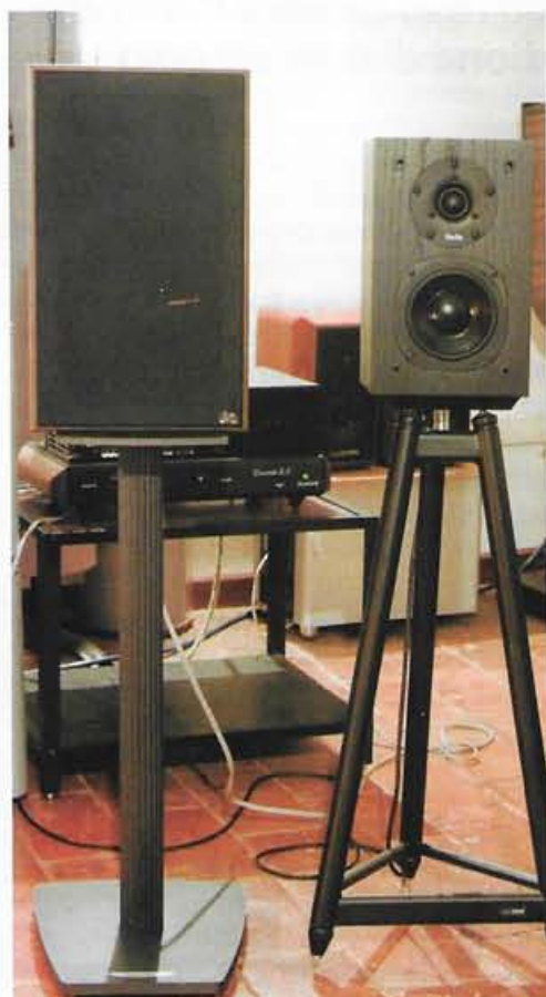
AQ Tango 85 in sala d'ascolto, accanto ad una ProAc Tablette Ten.