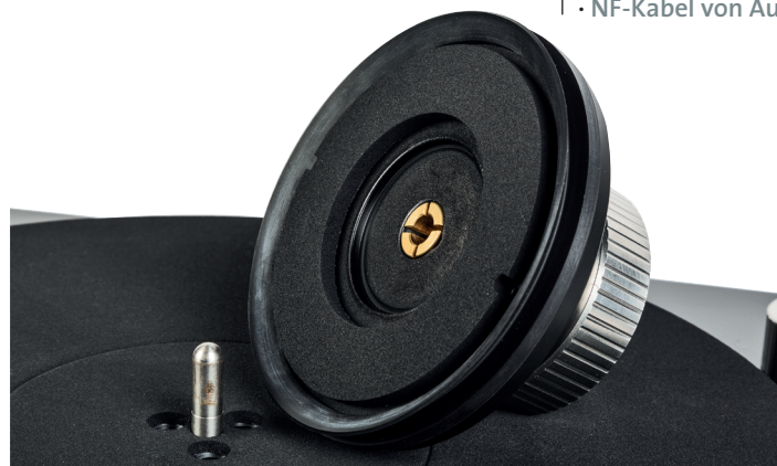
Plattenklemme mit flüssigkeits-sperrender Gummilippe – funktioniert