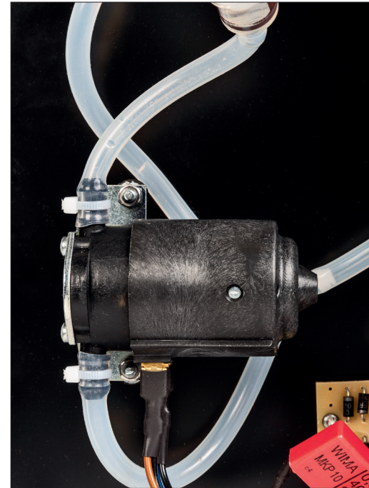
Mit der Pumpe wird die Reinigungsflüssigkeit aus dem Tank auf die Platte befördert