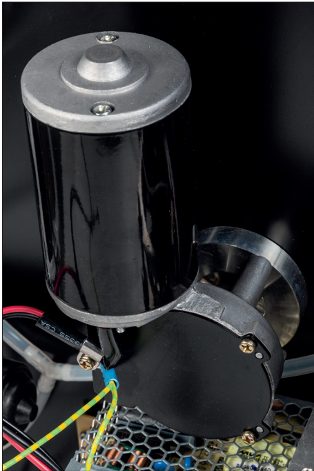
Der Antrieb lässt den Teller in jedem Betriebszustand mit gleichmäßiger Geschwindigkeit rotieren

Vorschein kam, war allenfalls mittelmäßig, aber immerhin: Ich konnte das zum ersten Mal auch wirklich beurteilen.