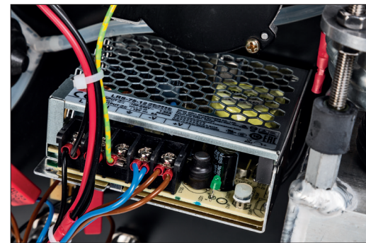
Alle elektrischen Komponenten werden über ein hochwertiges Schaltnetzteil versorgt